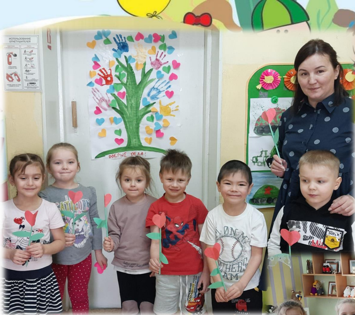
Ребята получили большое удовольствие от работы